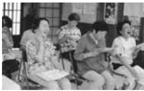
いきいきサロン活動