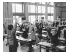
はつらつ介護予防教室